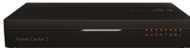
Home Center 3